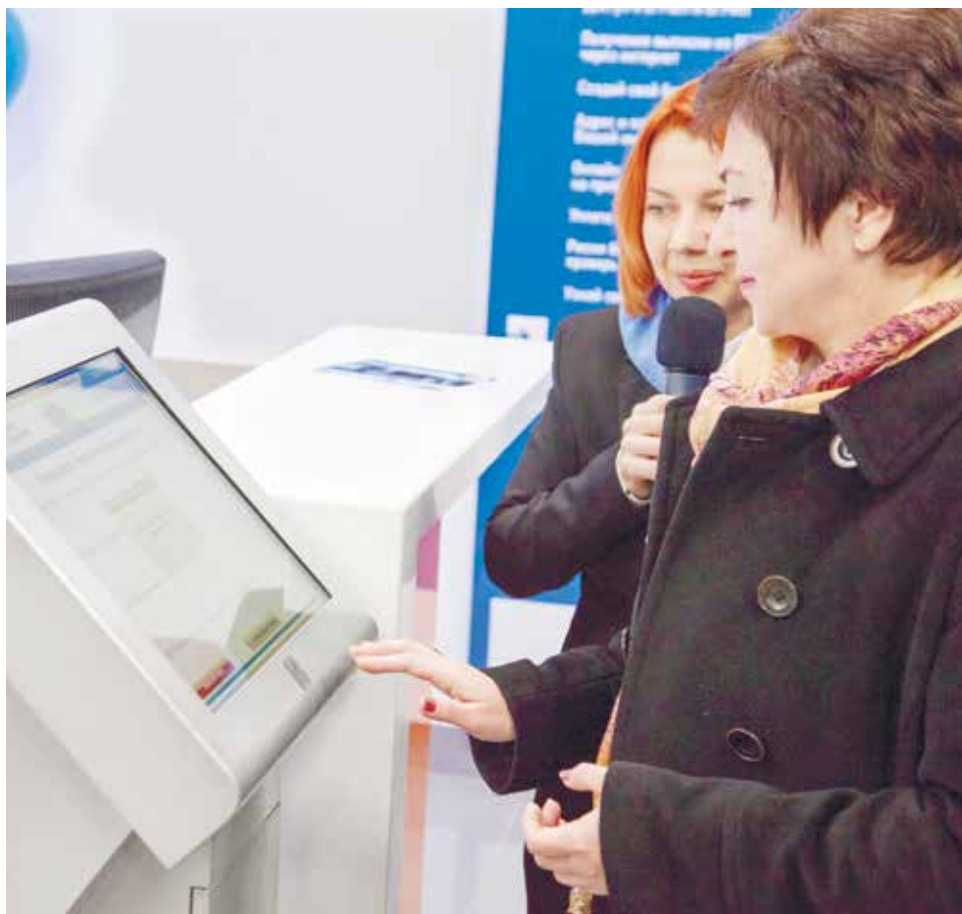
Заместитель председателя Правительства Ставропольского края – министр финансов Ставропольского края Лариса Калинченко получает талон на обслуживание.

лиц», который начал функционировать в пилотном режиме, уже подключилось 175 налогоплательщиков. Пользователями сервиса осуществлено более 6 тысяч входов и направлено 1962 запроса на получение услуг. «Личным кабинетом для физических лиц» в крае уже активно пользуется более 30 тысяч налогоплательщиков.