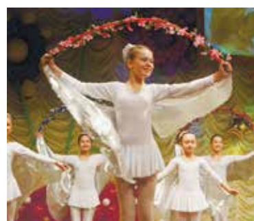
Самый младший член семьи Соловьевых тоже рад поучаствовать в общем празднике.

ли героям праздника и членам их семей памятные подарки и цветы, а сотрудники районных управлений Пенсионного фонда демонстрировали гостям свои многочисленные таланты: пели, танцевали, читали стихи. В зрительном зале присутствовали станичники и жители района, которые пришли поддержать своих земляков и еще раз порадоваться их успехам.