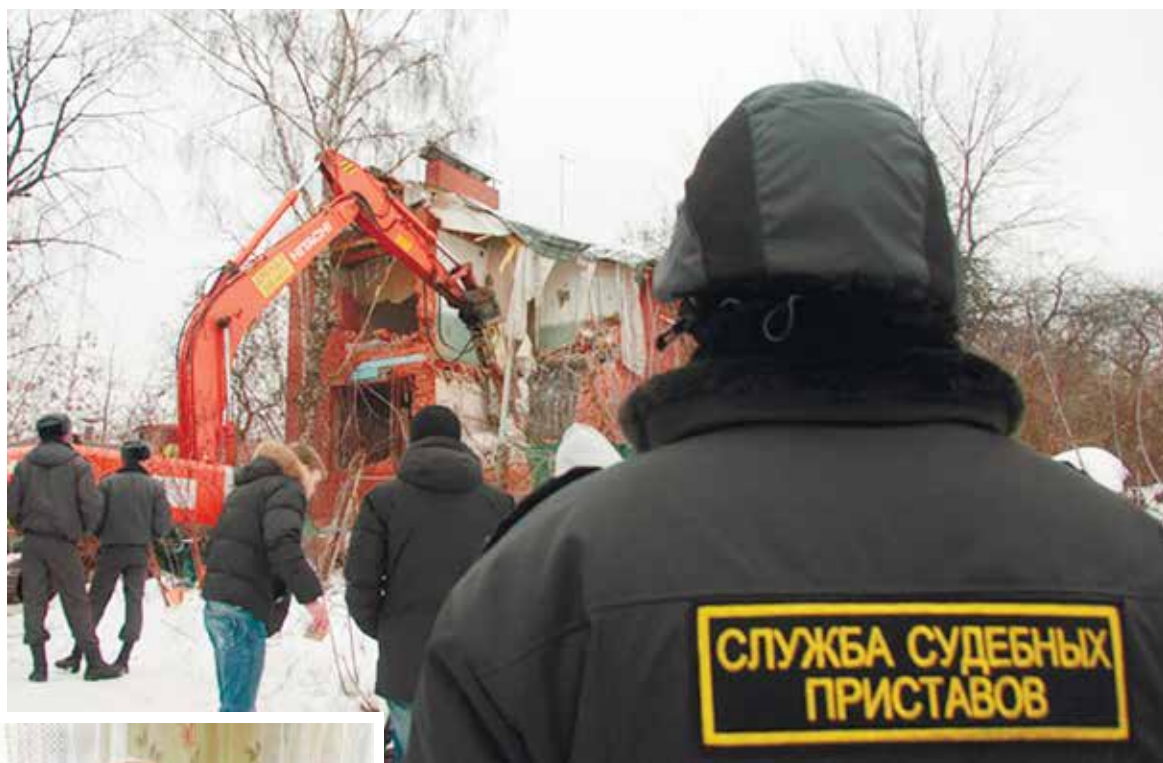
Снос незаконно возведенного здания судебными приставами Пятигорского ГО.

Не все граждане знают, что судебные приставы, исполняя решение суда, не только обращают взыскание на денежные средства или имущество должников, но и обязывают неплательщиков совершить или воздержаться от совершения определенных действий.