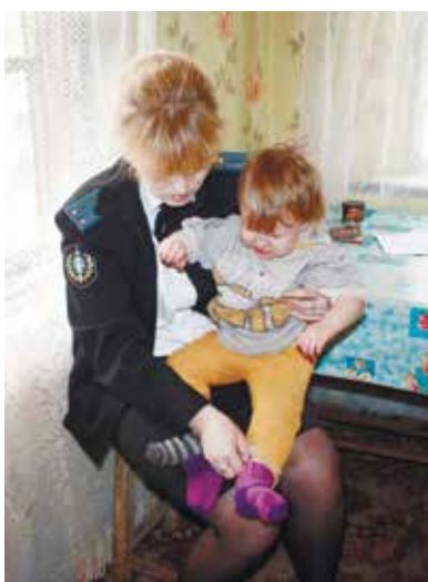
Исполнительные действия по отобранию ребенка производятся судебными приставами Новоселицкого РО;