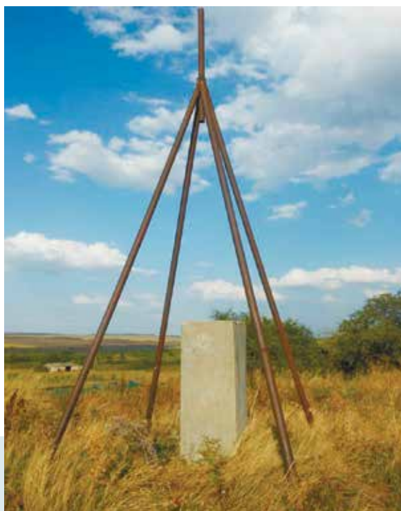
Из 590 геодезических пунктов на Ставрополье полностью сохранены только 70.

Управлением Росреестра по Ставропольскому краю проведен мониторинг пунктов государственных геодезических сетей. Результаты проведенного обследования неутешительны.