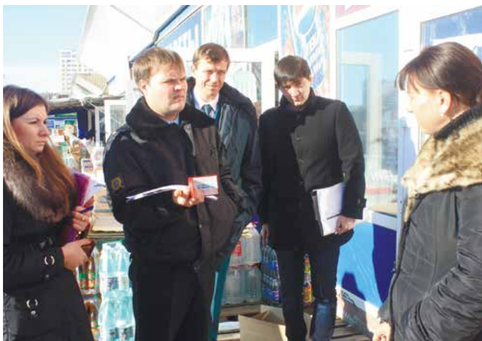
Рейд судебных приставов Промышленного РО г. Ставрополя, представителей налоговой службы и администрации/

Так, встреча с предпринимательницей, развернувшей нелегальную торговлю на улице, произошла недалеко от районного отдела судебных приставов, где на этот раз «неуловимая» продавщица фруктов и овощей не смогла скрыться от представителей закона, а пыталась... О своих 43 штрафах, назначенных административной комиссией, «бизнес леди» знает и помнит, только выплатить накопившиеся 112 000 рублей не торопится, ссылаясь на безденежье. А вопрос судебных приставов о том, зачем тогда в течение двух лет с завидным постоянством выходить на улицу и заниматься неприбыльным делом, так и остался без ответа. Арестовав у женщины весы, работники службы предупредили неплательщицу, что если в течение 10-ти дней она не образумится, то определять вес товара будет «на глаз».