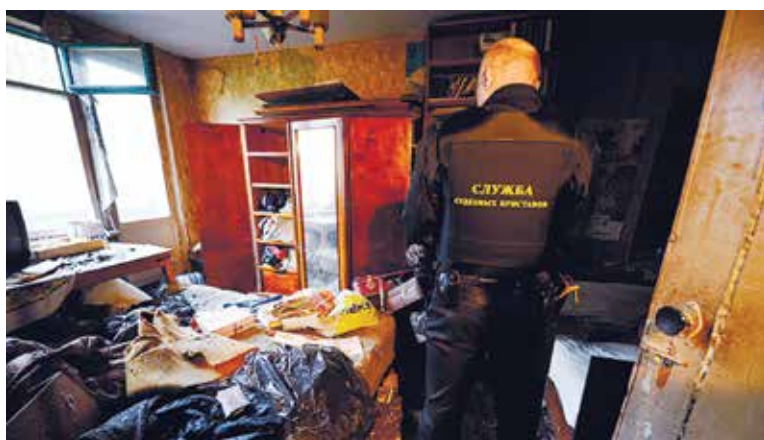
Выселение должника по кредитам судебными приставами Промышленного РО г. Ставрополя.

настолько меняется, что права взыскателя как таковые не защищаются. К примеру, исполненные редакцией СМИ обязанности опубликовать опровержение либо реализовать установленное ст. 46 Закона «О средствах массовой информации» право взыскателя на ответ возможно исключительно посредством позитивных действий должника.