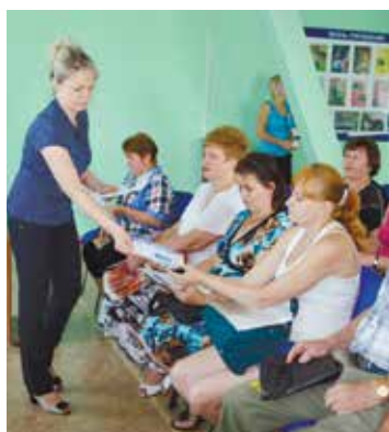
Пенсионная грамотность нужна всем - и пожилым, и молодым.

Кроме того, на Ставрополье вот уже семь лет продолжают успешно работать так называемые «пенсионные школы» для молодых пенсионеров. Специалисты также проводят занятия на